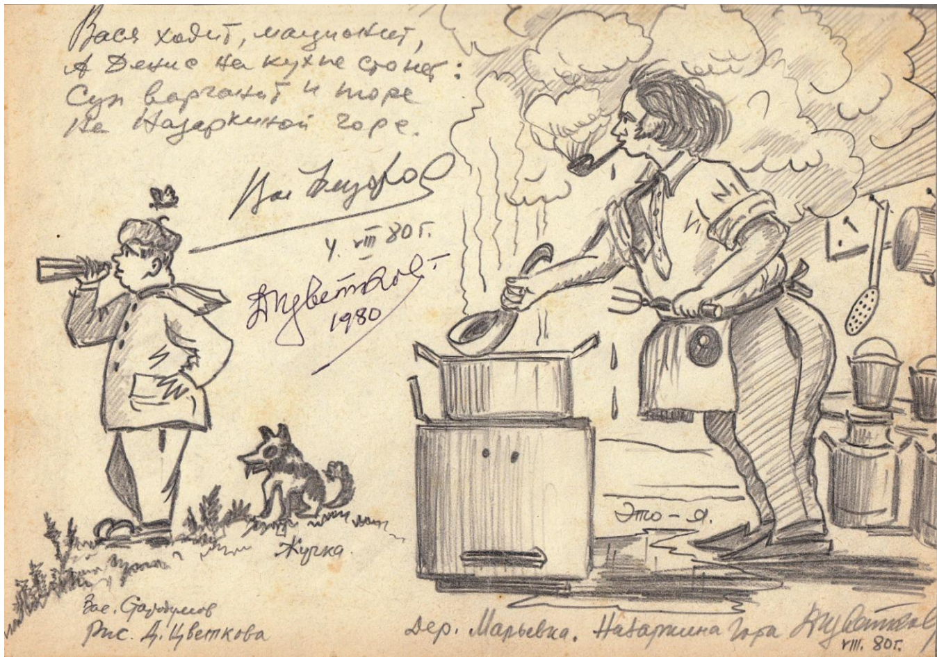
Рисунок из альбома поэта-Д. М. Цветкова