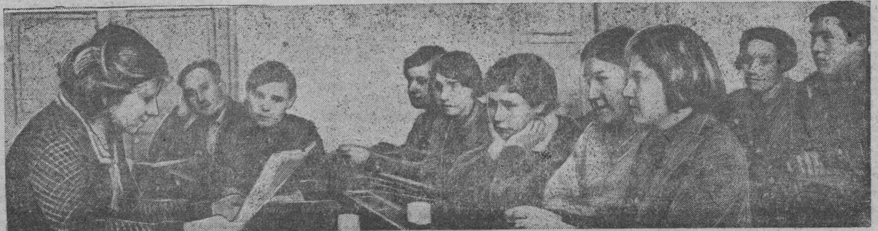
НА СНИМКЕ: ученики 11-й средней школы (Иркутск) знакомятся с решениями X пленума ЦК ВЛКСМ.