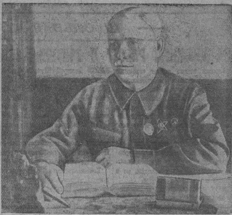
Указом Президиума Верховного Совета СССР от 2 января 1940 г. за выдающиеся заслуги в деле изобретения и конструирования новых особо важных образцов вооружения Красной Армии Василию Алексеевичу Дегтяреву присвоено звание Героя Социалистического Труда с вручением высшей награды СССР — ордена Ленина и выдачей денежной премии 50 тысяч рублей. НА СНИМКЕ: В. А. Дегтярев.