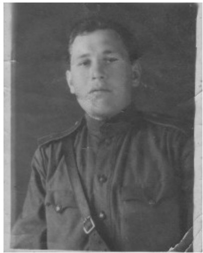
Фото с фронта (1943 г., 1944 г.)