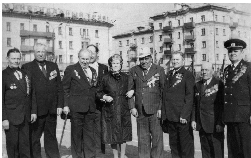
Ветераны шахты «Комсомолец» (1985 г.)