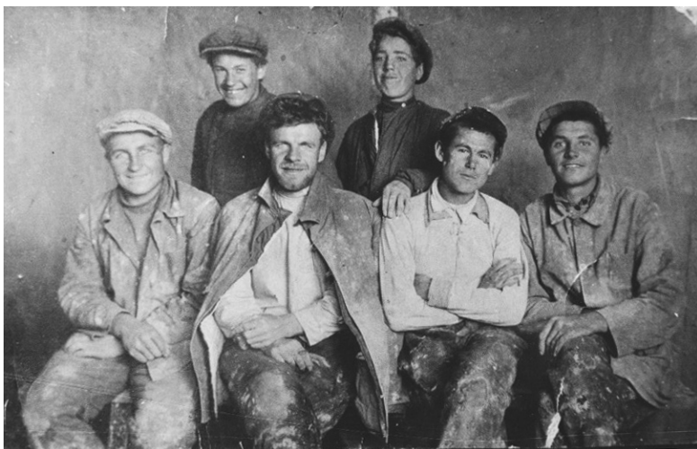
Практика. Учеба в горном техникуме