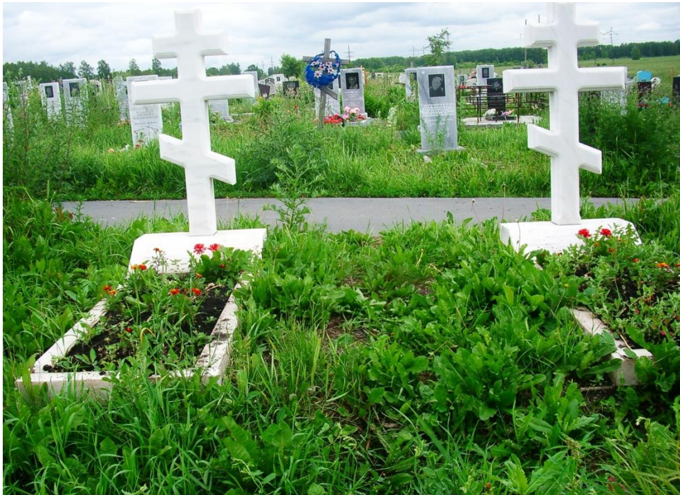
Последний приют Вовы и Светы (г. Кемерово, кладбище № 4, 1-й квартал, 3-я аллея)