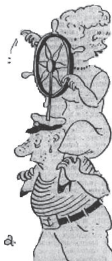
Рис. В. Александрова.

Доброй славой увенчана, Наш соратник и друг, Входит в комнату женщина – И светлеет вокруг! Вот поправила волосы, Аккуратность любя, – И улыбкой, и голосом Вмиг согрела тебя. Очень светлая, вешняя, Воедино слита Красота её внешняя И души красота... Всем взяла она – смелостью, Добротою своей. Вместе с женственной